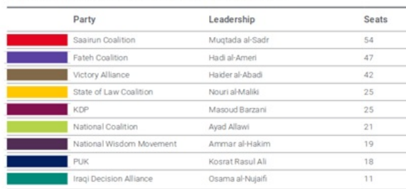
Table 1. Key Winners of the Iraqi Parliamentary Elections 2018